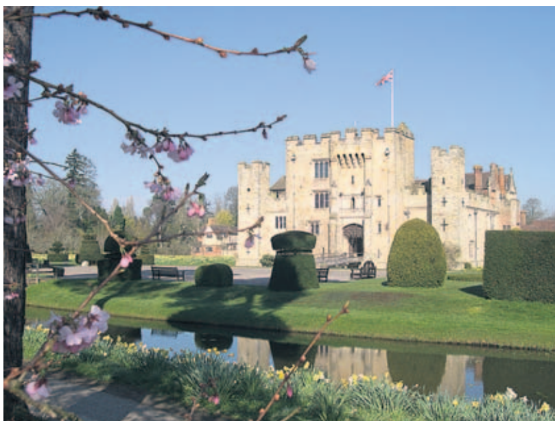
Hever Castle Onder: thee met scones, room en jam in het nieuwe Guthrie-restaurant van Hever Castle

Hendriks vijfde verbintenis, met een 19-jarige nicht van Anna Boleyn, Catherine Howard, liep eveneens op de klippen. Ze hield het met anderen en werd onthoofd. De zesde echtgenote van Hendrik overleefde hem: Catherine Parr. Als ezelsbruggetje leren de Engelsen daarom op school: divorce, beheaded, died; divorced, beheaded, survived . Hendriks vrouwen werden wel getypeerd als 'de verraden echtgenote, de verleidster, de goede vrouw, de lelijke zus, de stoute meid en de moederfiguur'.